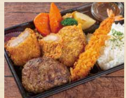
熟成ハンバーグDX 弁当 ——— ¥1,980 (税込¥2,138) ●えびフライ ●ひれかつ ●牛すじコロッケ