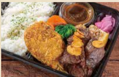
熟成牛サガリステーキ& 牛すじコロケ弁当