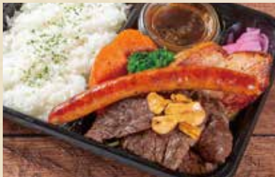
熟成牛サガリステーキ& デリカ弁当