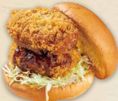
牛すじコロケバーガー