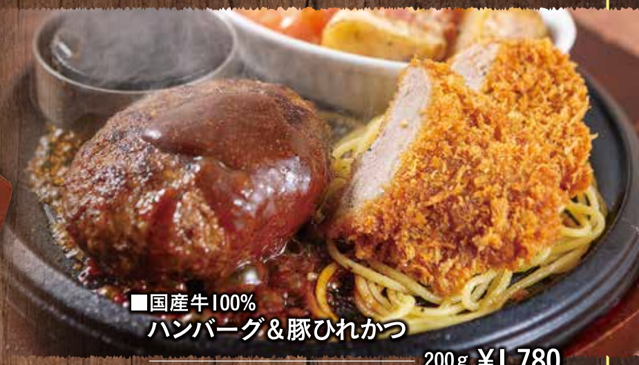
■国産牛100% ハンバーグ&豚ひれかつ 200g ¥1,780 (税込¥1,958)