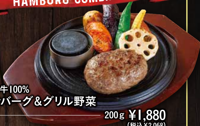
■国産牛100% ハンバーグ&グリル野菜 200g ¥1,880 (税込¥2,068)