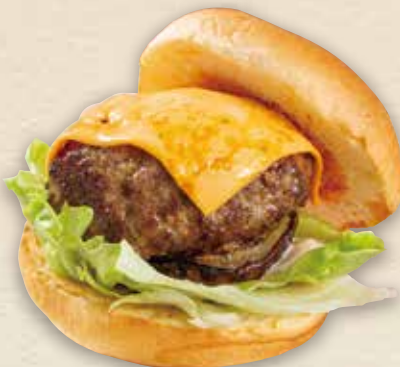
小清水牛チーズバーガー