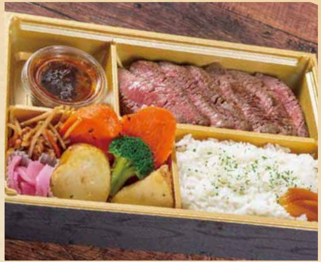
和牛 ステーキ御膳