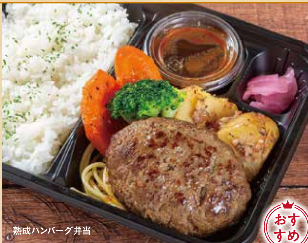
熟成ハンバーグ弁当