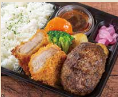
熟成ハンバーグ& 豚ひれかつ弁当 ——— ¥1,480 (税込¥1,598)