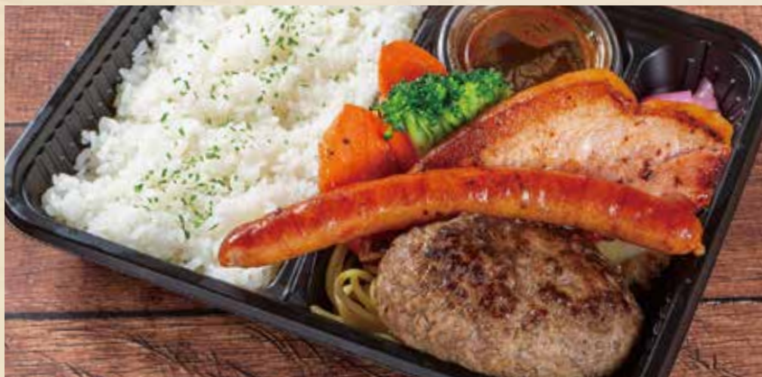
熟成ハンバーグ&デリカ弁当 ——— ¥1,680 (税込¥1,814)