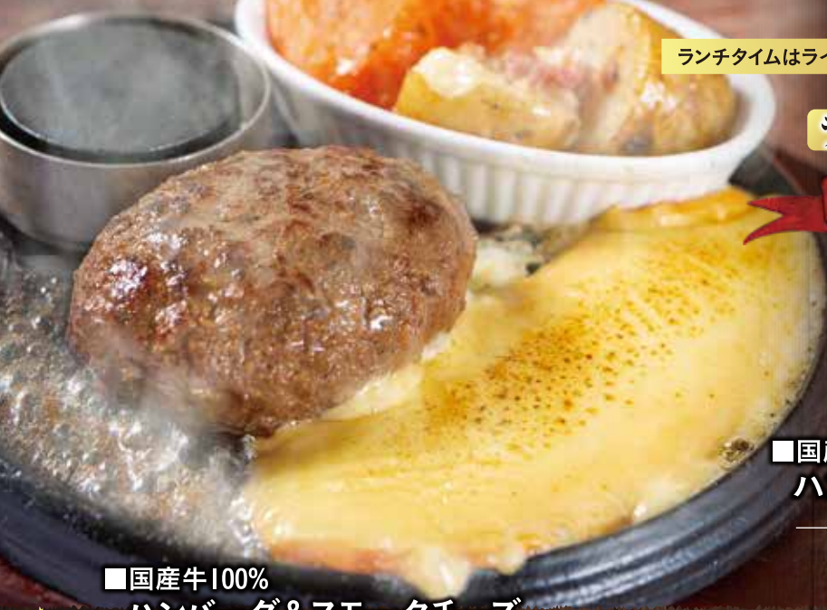
■国産牛100% ハンバーグ&スモークチーズ 200g ¥1,880 (税込¥2,068)