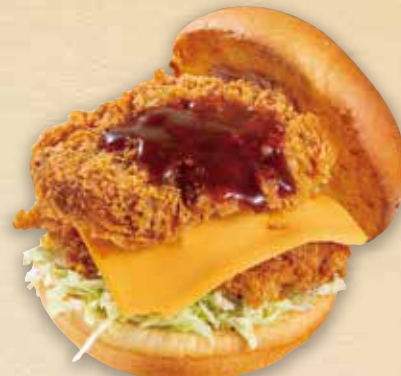
豚ヒレカツバーガー