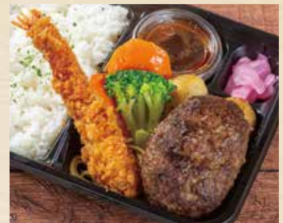
熟成ハンバーグ& えびフライ弁当 ——— ¥1,480 (税込¥1,598)