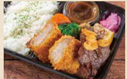
熟成牛サガリステーキ& 豚ひれかつ弁当