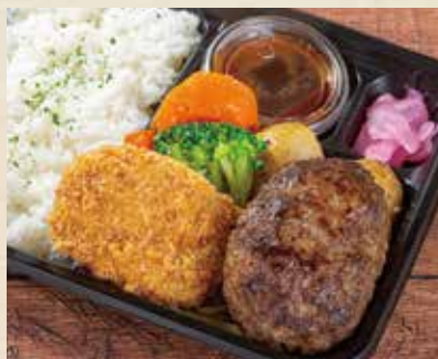
熟成ハンバーグ& 牛すじコロッケ弁当 ——— ¥1,480 (税込¥1,598)