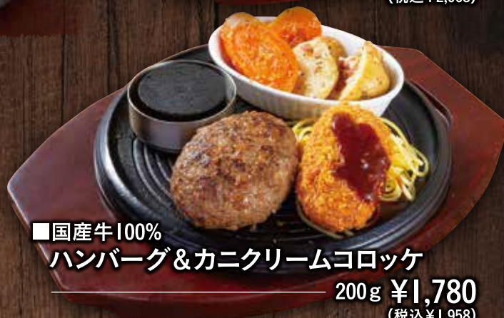
■国産牛100% ハンバーグ&カニクリームコロッケ 200g ¥1,780 (税込¥1,958)