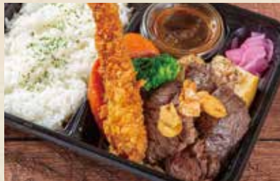
熟成牛サガリステーキ& えびフライ弁当