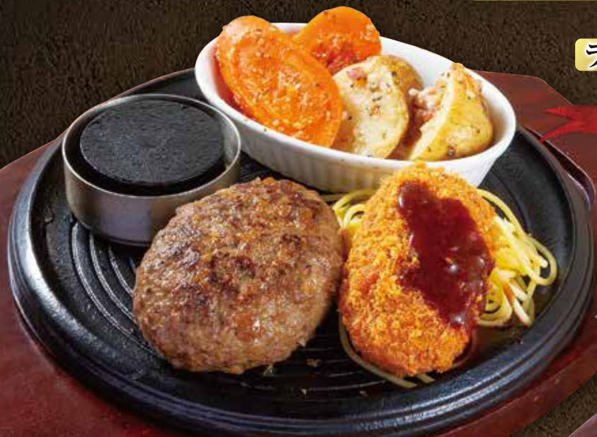
■小清水和牛 ハンバーグ&カニクリームコロッケ