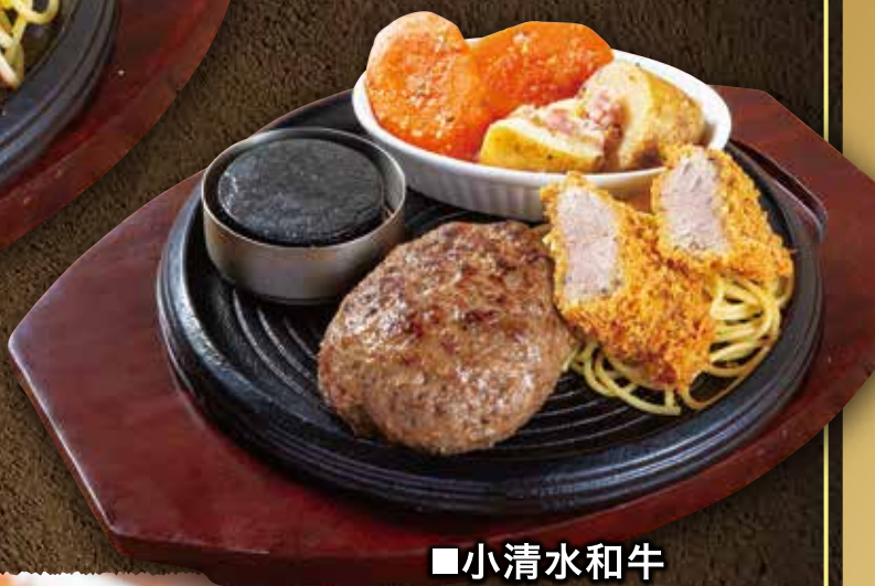
■小清水和牛 ハンバーグ& 豚ひれかつ