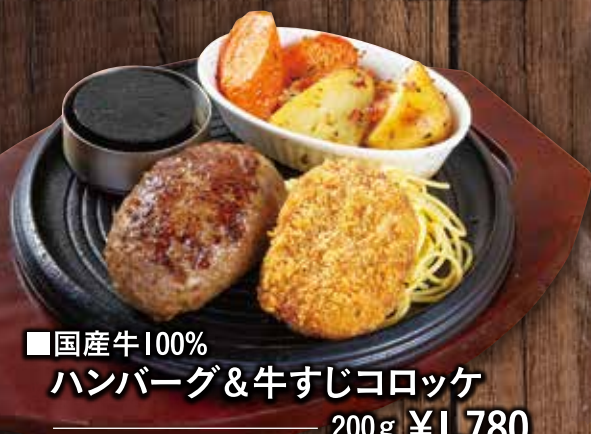
■国産牛100% ハンバーグ&牛すじコロッケ 200g ¥1,780 (税込¥1,958)