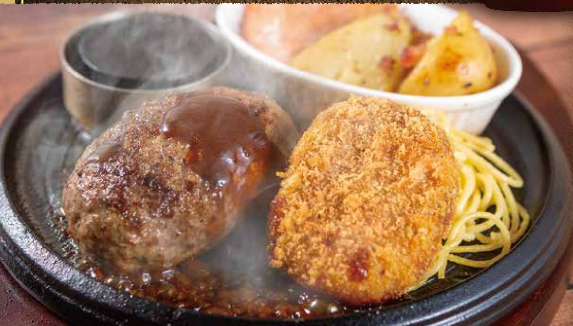
■小清水和牛 ハンバーグ& 牛すじコロッケ