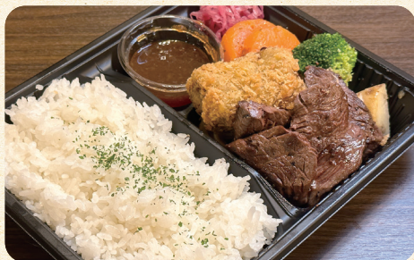
熟成牛サガリステーキ&牛すじコロッケ弁当 ¥1,200 (税込¥1,296)