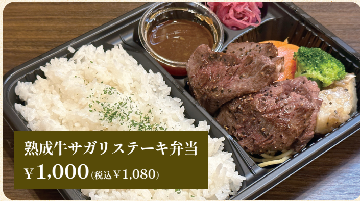
熟成牛サガリステーキ弁当 ¥1,000 (税込¥1,080)