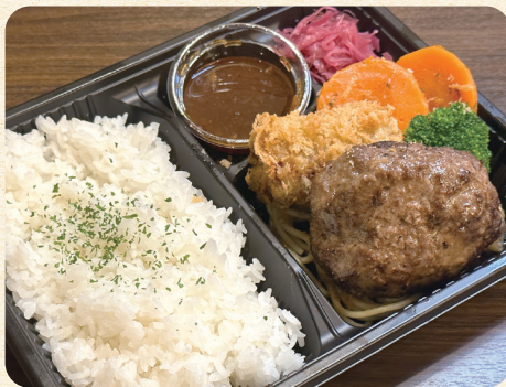
熟成ハンバーグ&牛すじコロケ弁当 ¥1,200 (税込¥1,296)