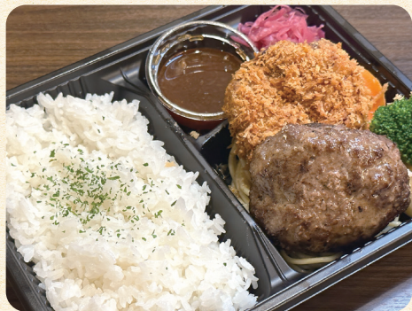
熟成ハンバーグ&豚ひれかつ弁当 ¥1,200 (税込¥1,296)