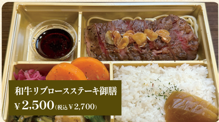
和牛リブロースステーキ御膳 ¥2,500 (税込¥2,700)