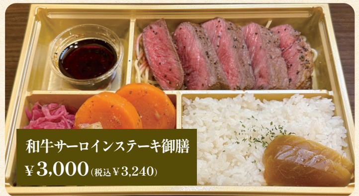
和牛サーロインステーキ御膳 ¥3,000 (税込¥3,240)