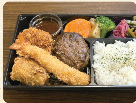
熟成ハンバーグDX弁当 【えびフライ、ひれかつ、牛すじコロケ】 ¥1,500 (税込¥1,620)