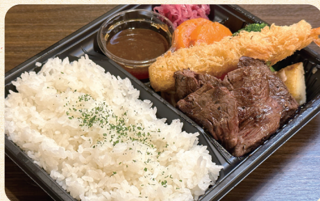
熟成牛サガリステーキ&えびフライ弁当 ¥1,200 (税込¥1,296)