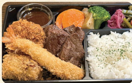
熟成牛サガリステーキ DX 弁当 【えびフライ、ひれかつ、 牛すじコロッケ】 ¥1,500 (税込¥1,620)