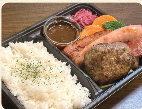
熟成ハンバーグ&デリカ弁当 ¥1,500 (税込¥1,620)