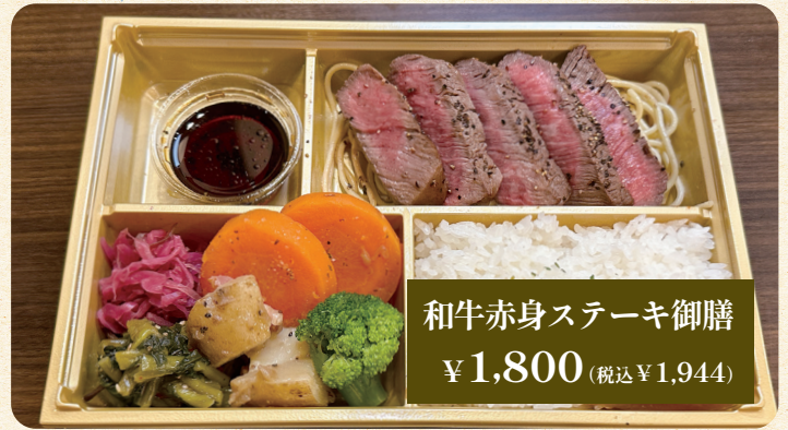
和牛赤身ステーキ御膳 ¥1,800 (税込¥1,944)