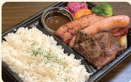
熟成牛サガリステーキ&デリカ弁当 ¥1,500 (税込¥1,620)