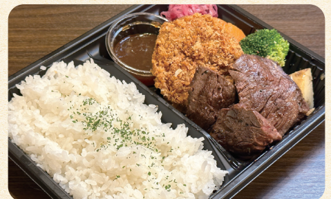
熟成牛サガリステーキ&豚ひれかつ弁当 ¥1,200 (税込¥1,296)