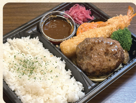
熟成ハンバーグ&えびフライ弁当 ¥1,200 (税込¥1,296)