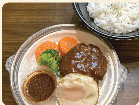
熟成ハンバーグロコモコ丼 ¥1,300 (税込¥1,404)