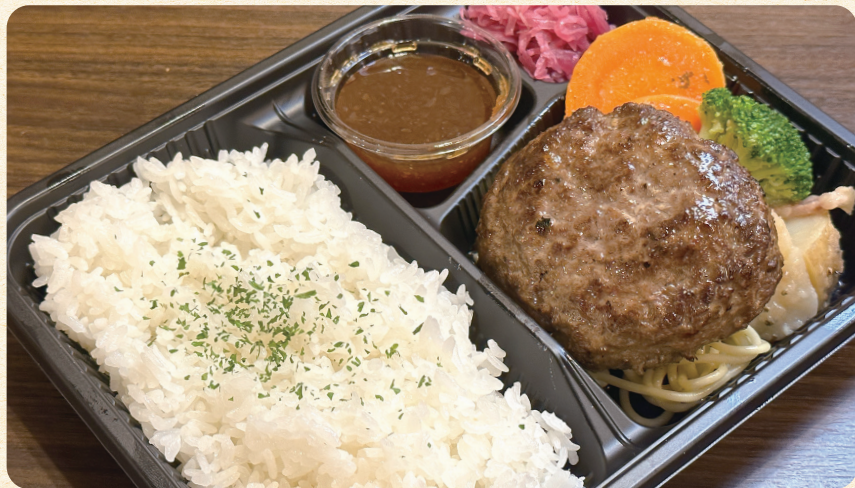
熟成ハンバーグ弁当 ¥1,000 (税込¥1,080)

※当店は、焼きたてを提供しております。 個数が多い場合は、お時間を いただく場合があります。 ライス大盛り+100円(税込108円)