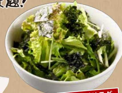
チョコレギサラダ