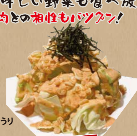
明太マヨキャベツ