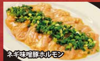
ネギ味噌豚ホルモン