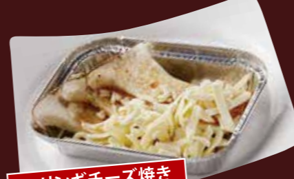
エリンギチーズ焼き