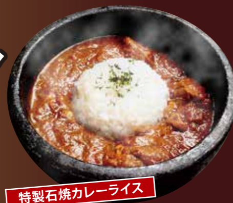
特製石焼カレーライス