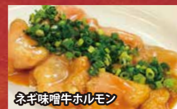
ネギ味噌牛ホルモン