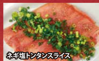
ネギ塩トンタンスライス