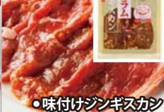
味付けジンギスカン