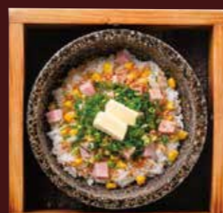
石焼ガーリックライス