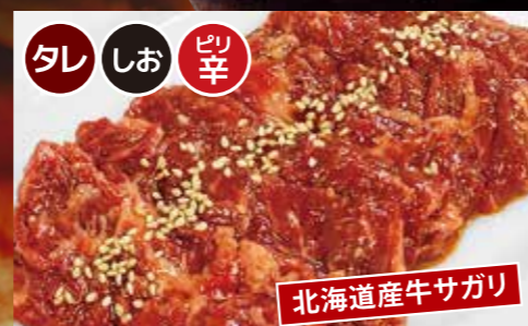
北海道産牛サガリ