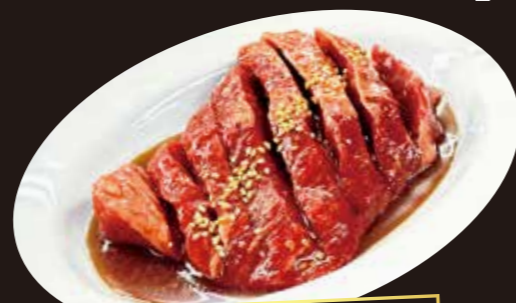
熟成牛ロースステーキ