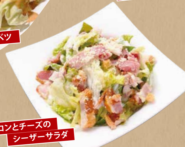
ベーコンとチーズのシーザーサラダ