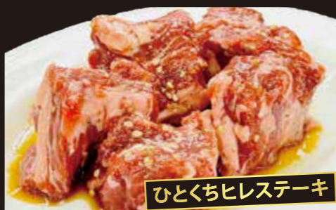
ひとくちヒレステーキ