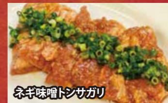
ネギ味噌トンサガリ