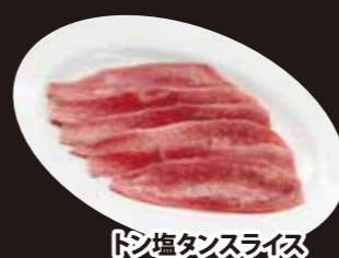
トン塩タンスライス