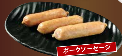
ポークソーセージ