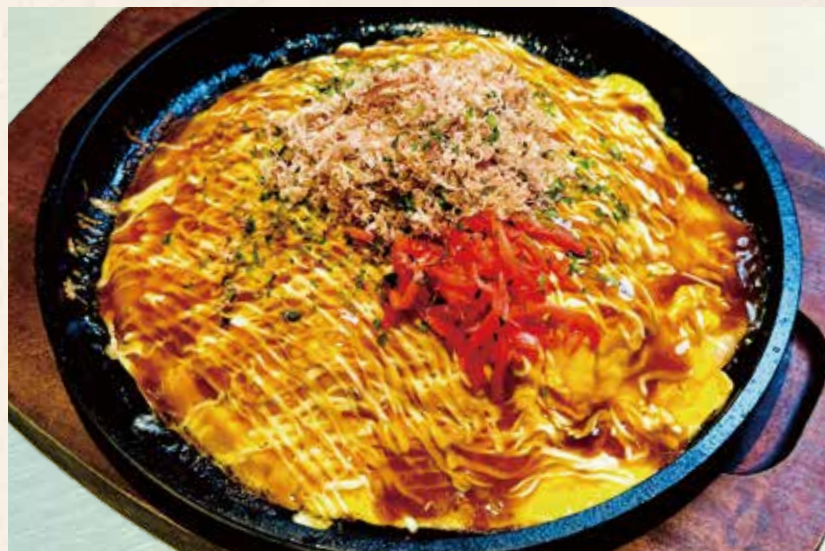
だし巻き玉子 580円 (税込638円)