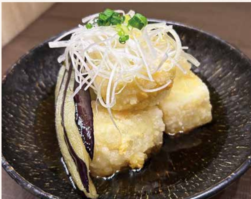
揚げ出し豆腐 580円 (税込638円)