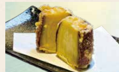
厚切りさつまいも