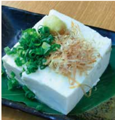
定番冷奴 480円 (税込528円)