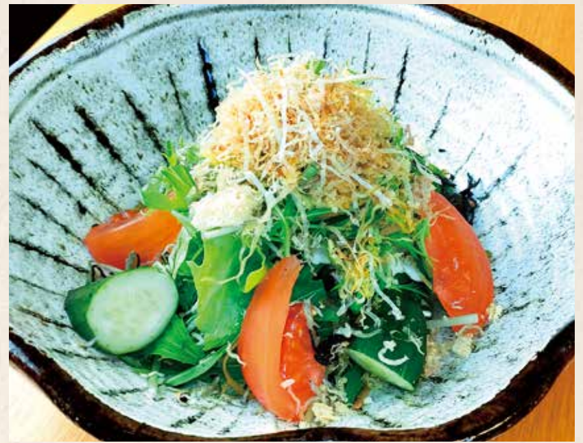
じゃこと水菜のサラダ 780円 (税込858円)