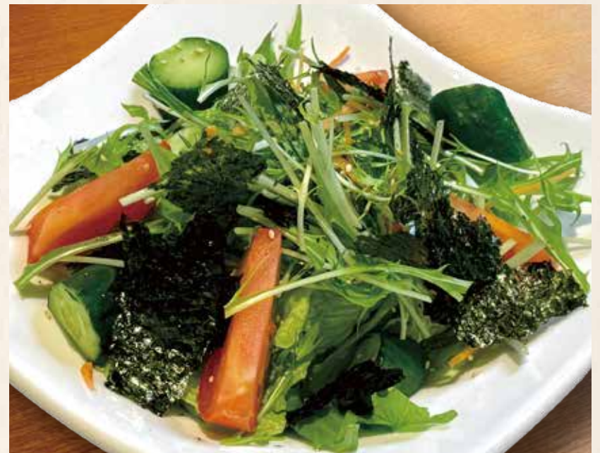
韓国風チョレギサラダ 580円 (税込638円)