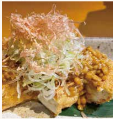
厚揚げ納豆 580円 (税込638円)