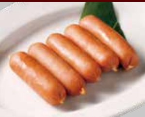
粗挽きソーセージ

粗挽きソーセージ つくね焼き 焼き鳥 イカ串焼き いいだこ塩麴焼き ちくわチーズ