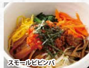
スモールビビンバ