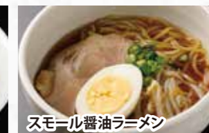
スモール醤油ラーメン