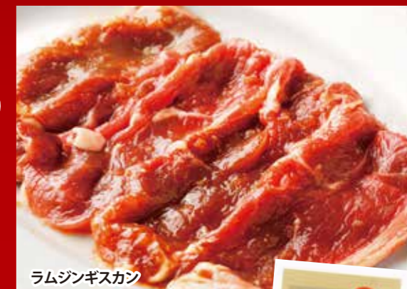
ラムジンギスカン