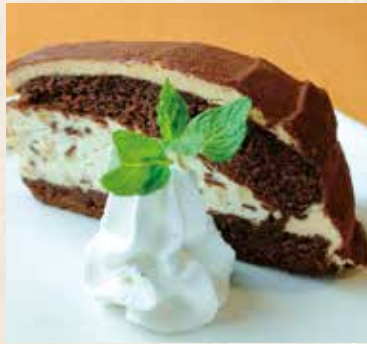
ショコラケーキ 380円 (税込418円)