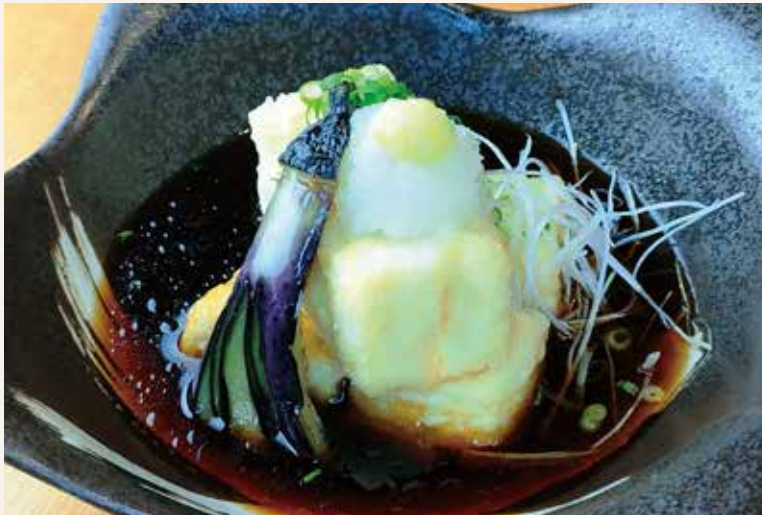
揚げ出し豆腐 580円 (税込638円)