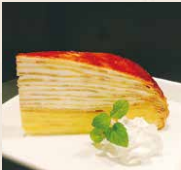
ダブルミルク ミルクレープ 380円 (税込418円)