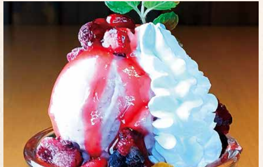
なごみ屋 ベリーパフエ 580円 (税込638円)