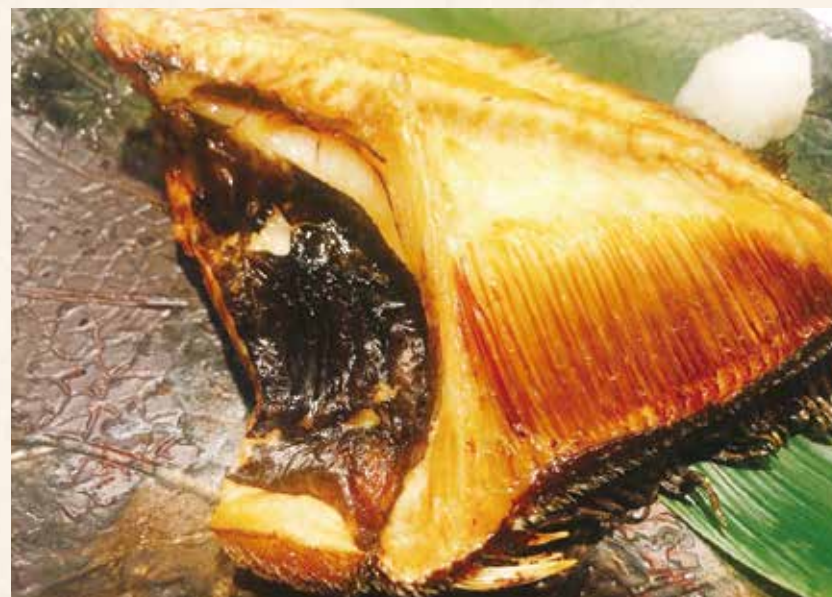
自家製 マトウダイ半身炭焼き