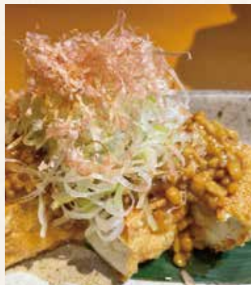
厚揚げ納豆 580円 (税込638円)