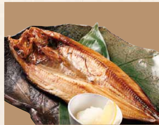
真ほっけ 一晩干し 980円 (税込1,078円)