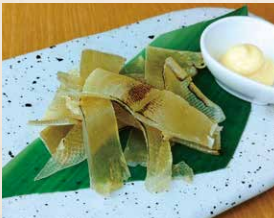
炙リエイヒレ 480円 (税込528円)