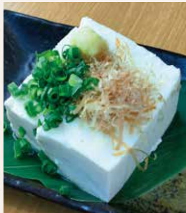
定番冷奴 380円 (税込418円)