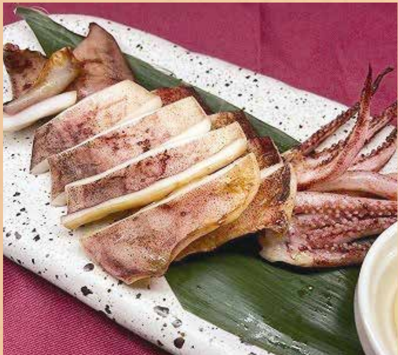
自家製イカの一晩干し 580円 (税込638円)