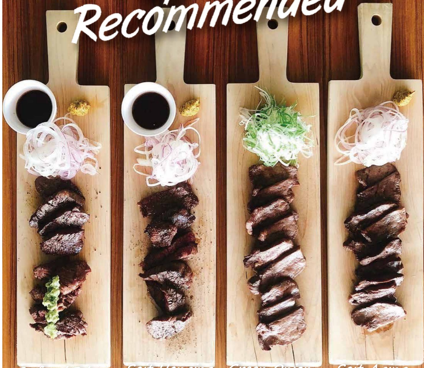
Beef and Poke